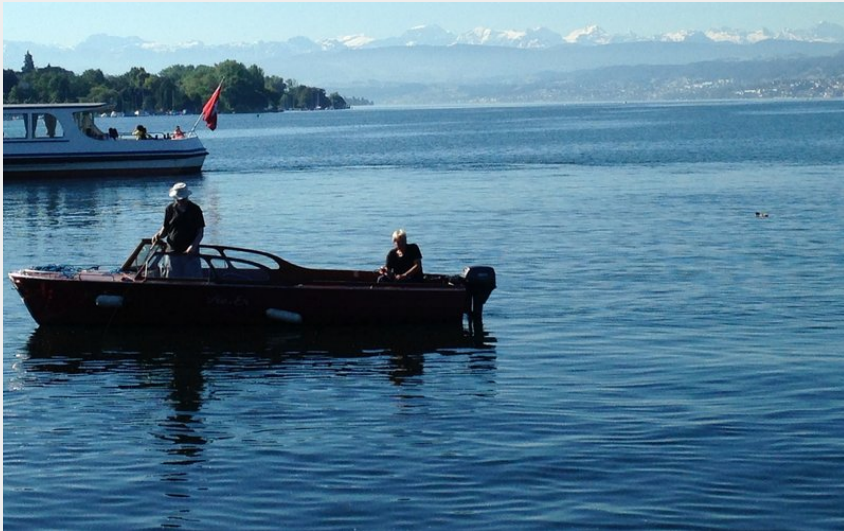
lac Zurich (Amis St Coloman)