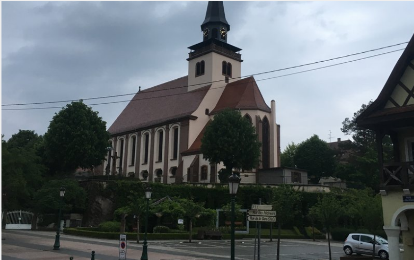
Église de la Sainte-Trinité à Lauterbourg (Amis de saint Coloman)