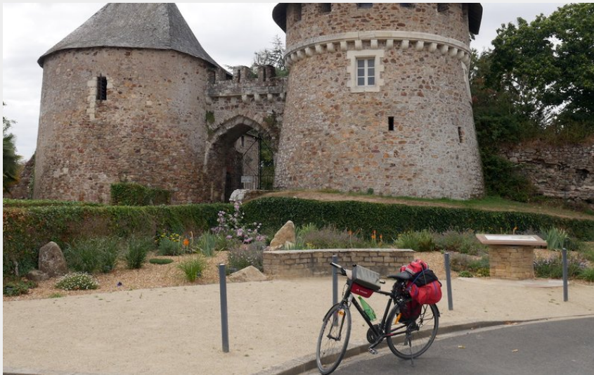
Porte de l'ancienne ville et du château de Champtoceaux (Amis saint Colomban)