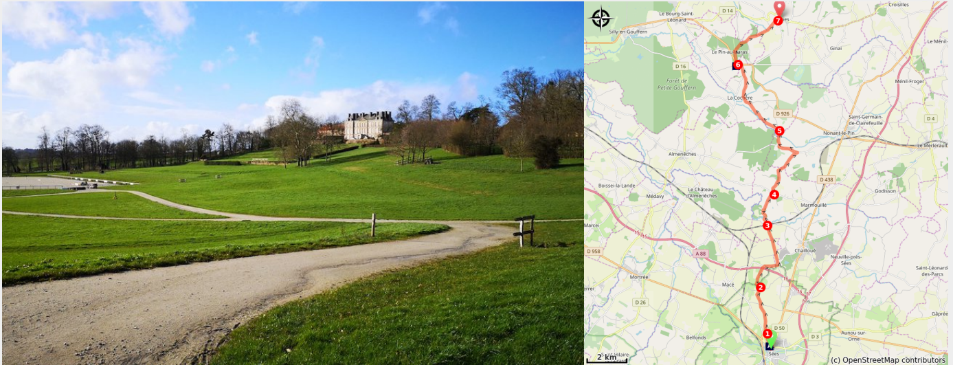
Château au Haras du Pin (Amis saint Colomban)

Marcher vers les haras et leurs chevaux qui vous accompagnent dans un joli paysage.