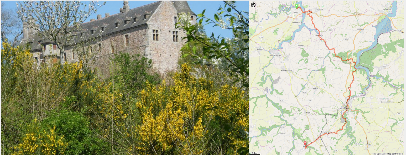
Château de la Roche Jagu (Amis Bretons de Colombar)