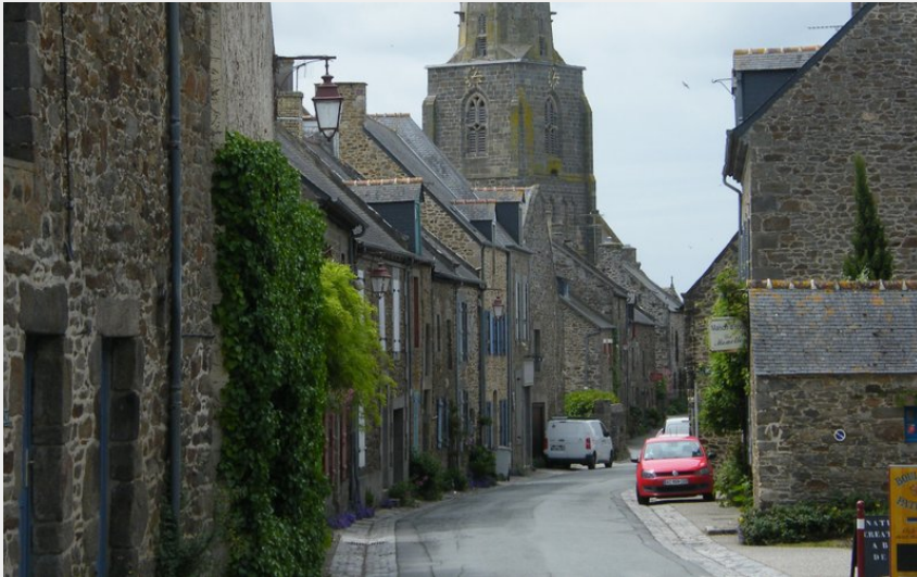
St Suliac (Amis Bretons de Colombran)