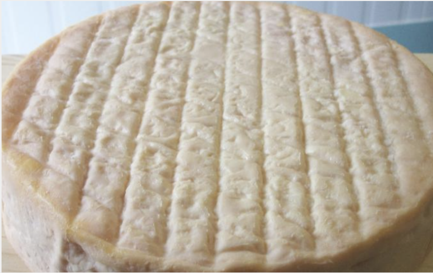
Attribution : Ruisseau des Écrevisses