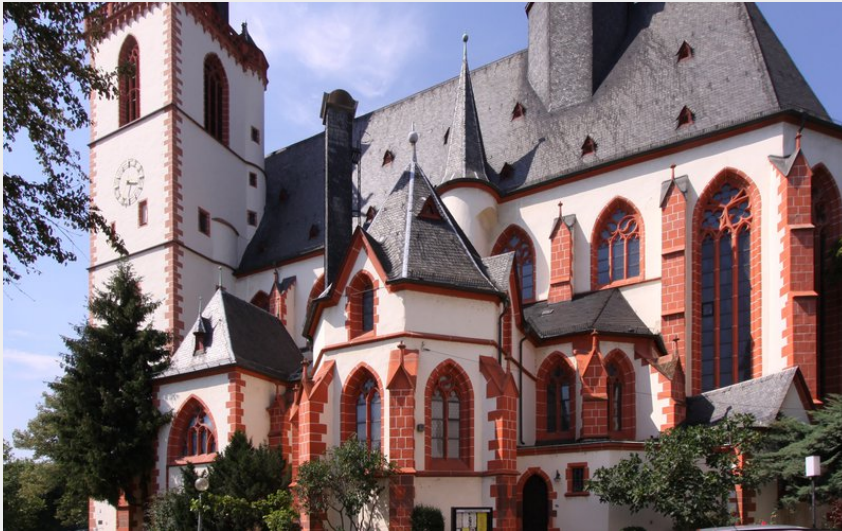
Basilique Saint Martin à Bingen