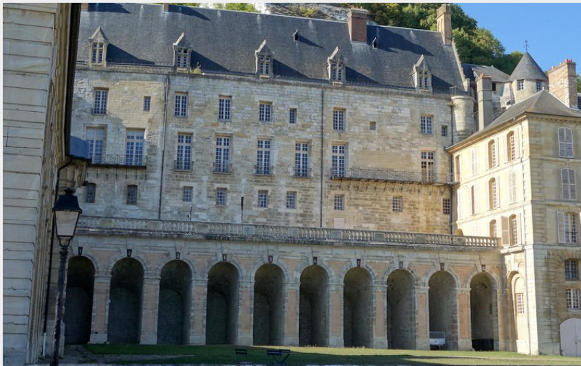
Château de la Roche-Guyon (Association Colombar en Brie)