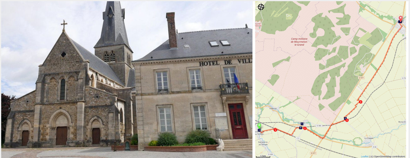
L'église Saint-Martin et l'Hôtel de Ville à Suippes

Une étape dans les champs de la Champagne qui ont été marqués par l'Histoire pour rejoindre le patrimoine de Suippes.