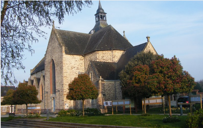
Eglise de Plélan le Grand (Amis Bretons de Colomban)