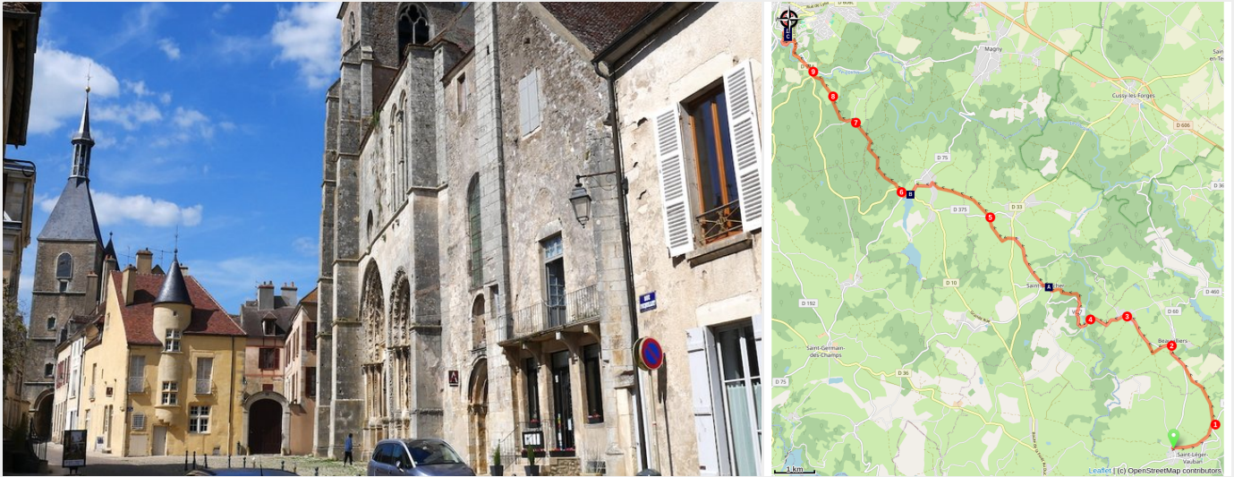
Façade de l'église Saint-Lazare et la Tour de l'Horloge (Amis saint Colomban)

Comme les étapes précédentes, les paysages du Morvan se succèdent en alternant avec des forêts, des prairies et des étangs.