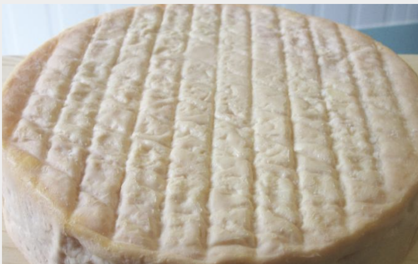
Credito fotografico : Ruisseau des Écrevisses