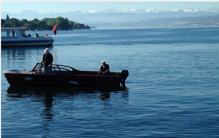
lac Zurich (Amis St Colomban)