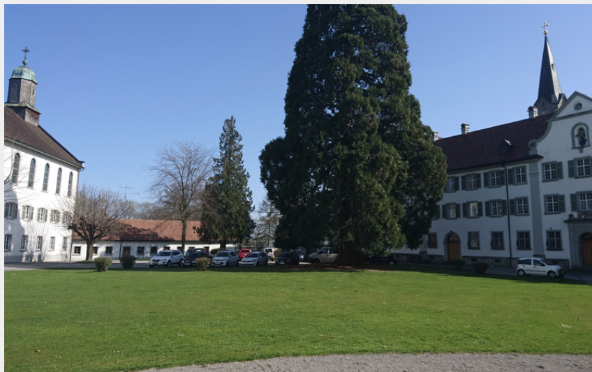
Bregenz (Amis St Colomban)