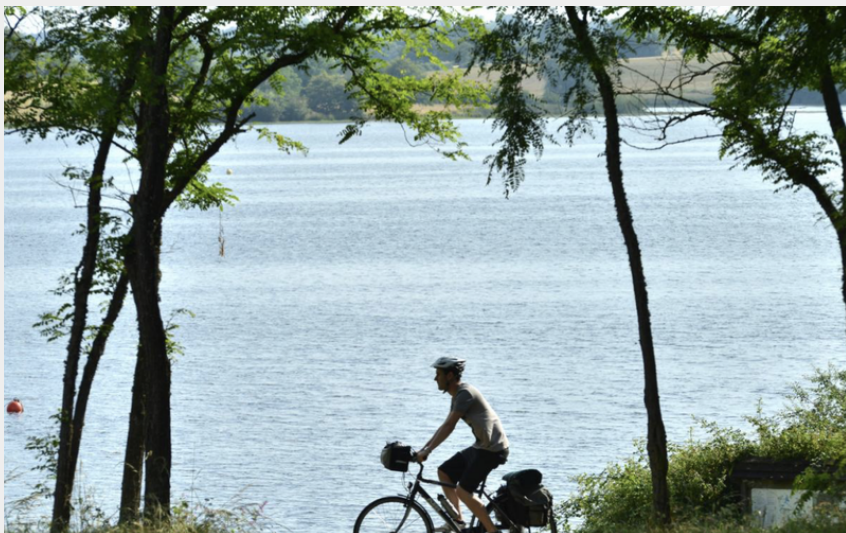
Lac de Côme