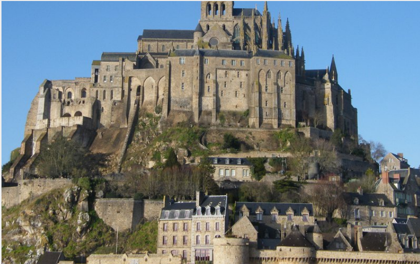
Le Mont St Michel (Amis Bretons de Colomban)