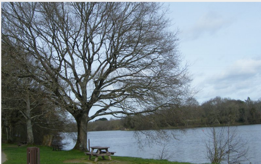
L'Erdre (Amis Bretons de Colomban)