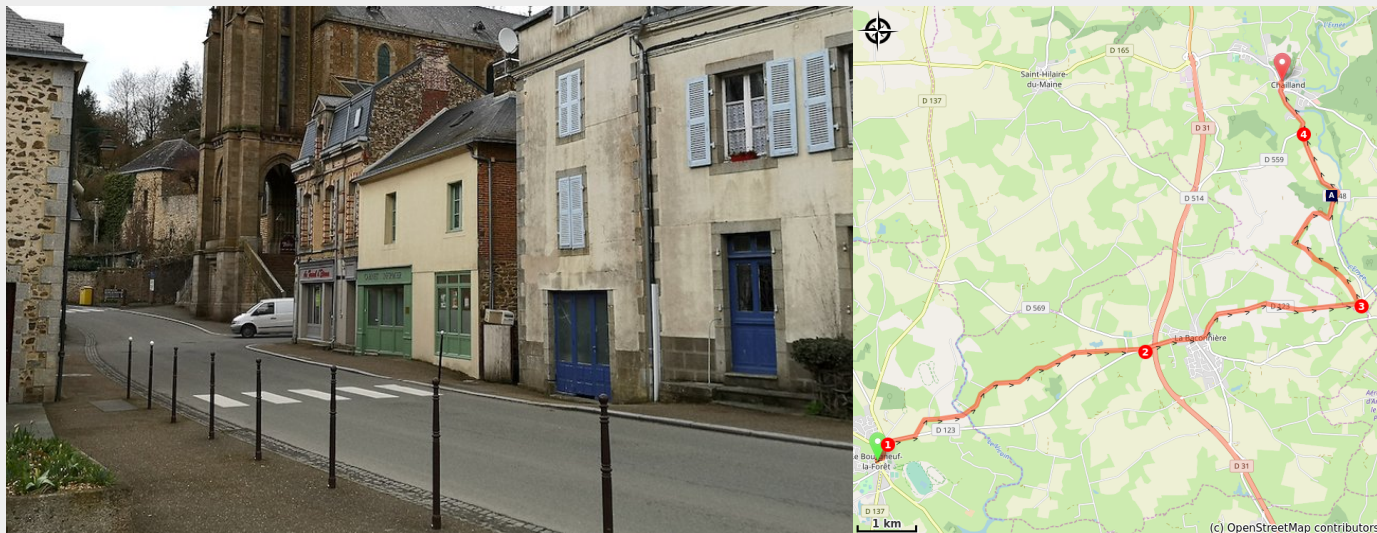
Église Notre-Dame au centre de Chailland (Amis saint Colomban)