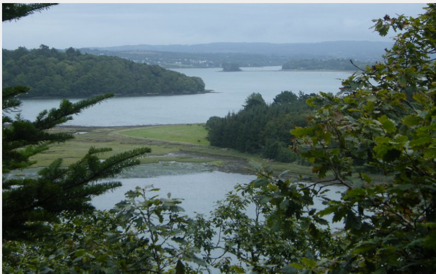
L'Aulne (Amis Bretons de Colombran)