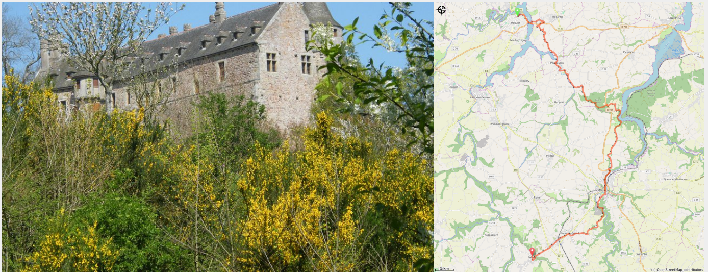
Château de la Roche Jagu (Amis Bretons de Colombar)