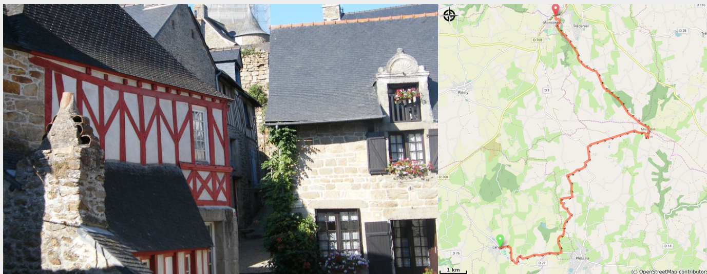
Moncontour (Amis Bretons de Colombran)