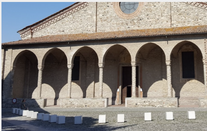
Bobbio (Amis saint Colomban)