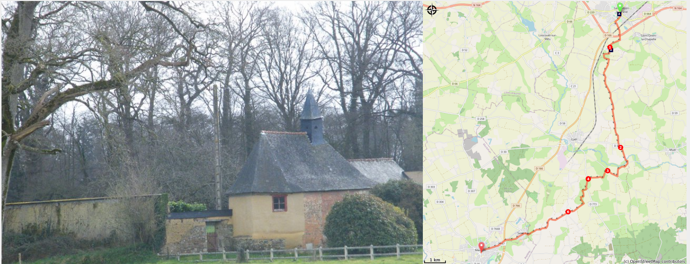
Chapelle du château des Gravelles (Amis Bretons de Colombar)