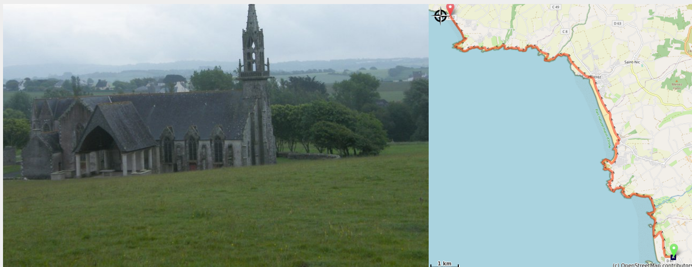
Ste Anne la palud (Amis Bretons de Colombran)