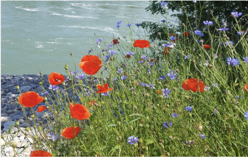
Rhin (Amis St Colomban)